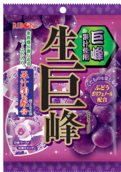
生食感ペースト入り巨峰キャンディ 84g 生巨峰