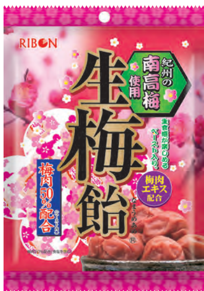
愛されつづけて40周年! 90g 生梅飴